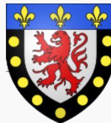
Maires de Poitiers