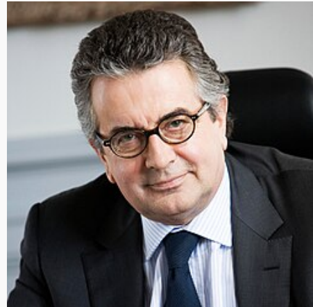
Alain Claeys en 2012.