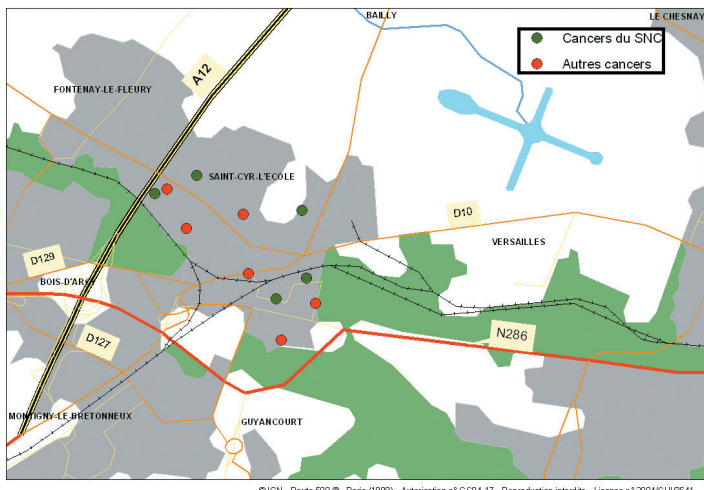
Carte 1 : distribution spatiale des cas de cancers infantiles tous types et du système nerveux central, de 1990 à 2002, à Saint-Cyr-L'Ecole (78).

Le nombre total de cas de cancer de l'enfant observés sur la commune est 2 fois supérieur au nombre de cas attendus. Cependant cette observation est compatible avec les fluctuations possibles autour de l'incidence moyenne. On observe une plus grande proportion de tumeurs du SNC que dans les populations de référence. Cette proportion reste également compatible avec les variations possibles de cette proportion dans un échantillon de 11 cas de cancer, caractérisant ainsi un phénomène certes peu fréquent mais non exceptionnel. Les cas sont distribués sur l'ensemble de la commune et ne montrent pas de tendance au regroupement géographique ni dans le quartier de l'Epi d'Or ni dans un autre quartier de Saint-Cyr-L'Ecole. De plus, les cas de cancer s'étalent de 1991 à 2001. Ils ne sont pas regroupés dans le temps.