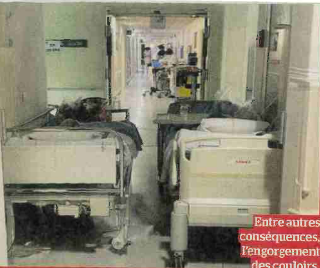
Entre autres conséquences, l'engorgement des couloirs.