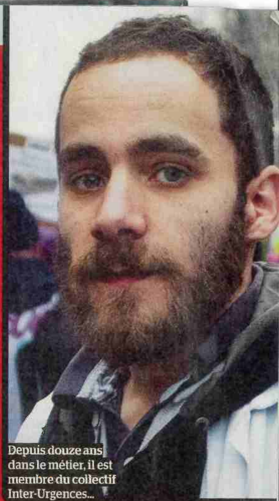
Depuis douze ans dans le métier, il est membre du collectif Inter-Urgences...

Être infirmier, c'est devenu comme le métier de caissier : au bout de trois ou quatre ans max, on a envie de partir.