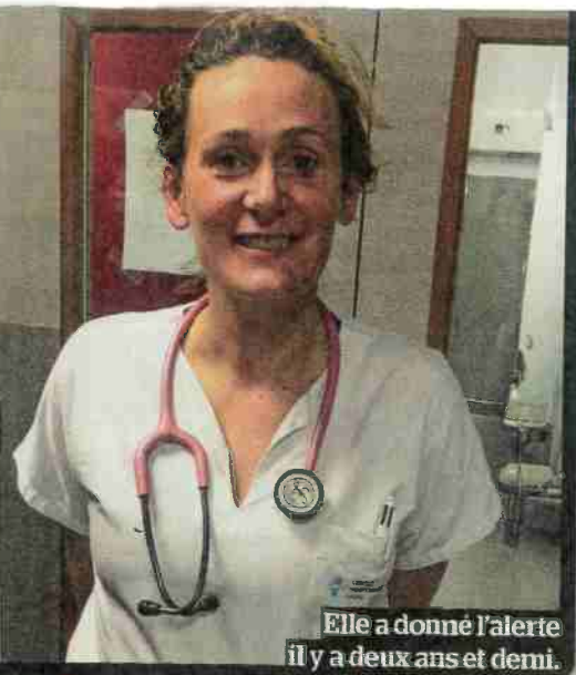
Elle a donné l'alerte il y a deux ans et demi.