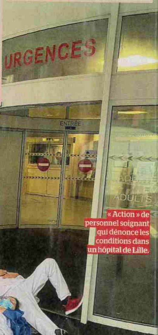
« Action » de personnel soignant qui dénonce les conditions dans un hôpital de Lille.

Ces décès ont souvent plusieurs facteurs, et nombre de ces drames sont passés sous silence.