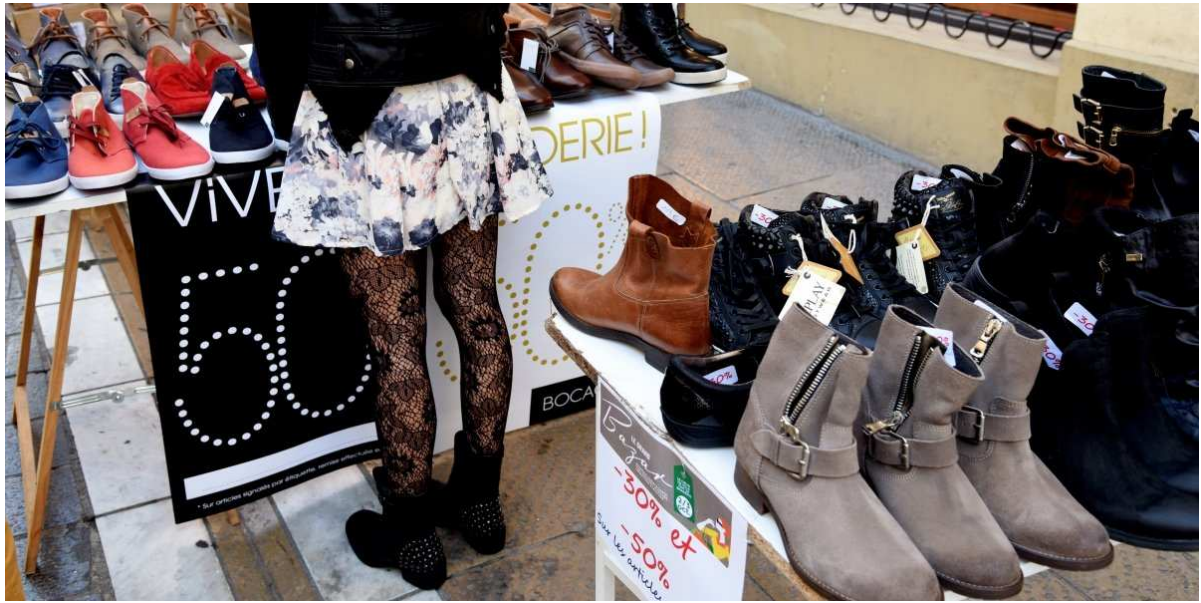
Agde : elle vole des bottes mais oublie ses clés de voiture dans le magasin il y a 15 heures 0