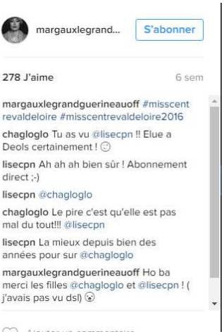
Margaux Legrand, la miss destituée, dévoile ses photos dénudées il y a 18 heures 20