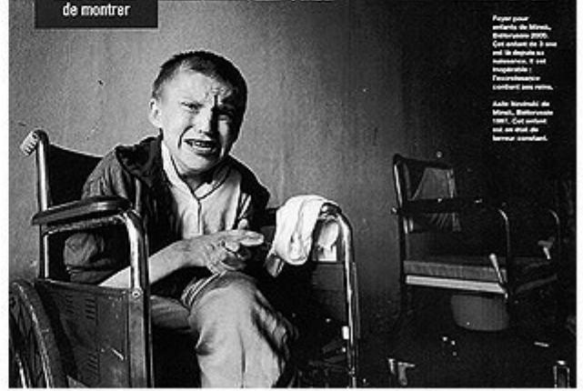
Asile Novinski, Minsk, Biélorussie 1997. Cet asile est le principal centre d'accueil pour enfants contaminés en Biélorussie.