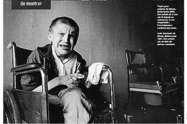
Asile Novinski, Minsk, Biélorussie 1997. Cet enfant est en état de terreur constant.