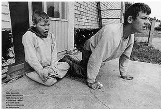
Asile Novinski, Minsk, Biélorussie 1997. Cet asile est le principal centre d'accueil pour enfants contaminés en Biélorussie.