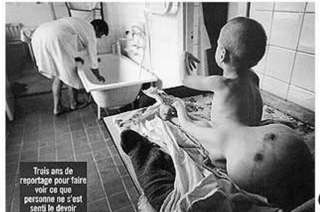
Trois ans de reportage pour faire voir ce que personne ne s'est senti le devoir de montrer